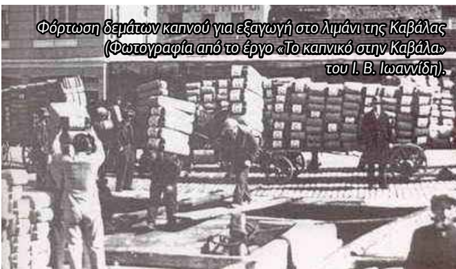
Φόρτωση δεμάτων καπνού για εξαγωγή στο λιμάνι της Καβάλας (Φωτογραφία από το έργο « Το καπνικό στην Καβάλα » του Ι. Β. Ιωαννίδη).

Εκτός από τη σημαντική ιστορική διάσταση, η καλλιέργεια του καπνού έχει προσφέρει σημαντικά οικονομικά οφέλη τόσο στον αγροτικό πληθυσμό της χώρας όσο και στην εθνική οικονομία, αποτελώντας για δεκαετίες το κυρίαρχο εξαγωγικό αγροτικό προϊόν της χώρας.