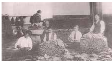
Επεξεργασία καπνού στη Λαμία το 1927

Για την παραγωγή του «Σέρτικου» χρησιμοποιούνταν κυρίως οι παραδοσιακές ποικιλίες καπνού τσεμπέλι και αράπικο