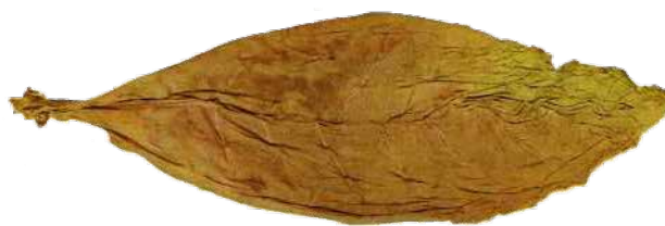
Φύλλο καπνού ποικιλίας Τσεμπέλι

(μαύρο). Οι ποικιλίες αυτές παρουσιάζουν ιδιαίτερα ποιοτικά χαρακτηριστικά, τα οποία αφορούν στη μειωμένη περιεκτικότητα σε πίσσα και νικοτίνη και τον ιδιαίτερα αρωματικό χαρακτήρα τους. Τα ποιοτικά αυτά χαρακτηριστικά οφείλονται τόσο στο γονιδιακό υπόβαθρο των ποικιλιών όσο και στην παραδοσιακά εφαρμοζόμενη στην Ελλάδα μέθοδο καλλιέργειας του καπνού και ωρίμασης των καπνόφυλλων με πλιο-ξήρανση και χαρακτηρίζουν και το καπνικό προϊόν «Σέρτικο». Οι ιδιαιτερότητες αυτές έχουν αναγνωριστεί διεθνώς εντάσσοντας το σύνολο των παραδοσιακών ελληνικών ποικιλιών στα Καπνά Ανατολικού Τύπου. Το έργο εστιάζει στη διευκρίνιση και ιστορική τεκμηρίωση της παραδοσιακής συνταγής του Σέρτικου, στην αποτύπωση και τεκμηρίωση των ιδιαίτερων ποιοτικών του χαρακτηριστικών και τέλος στην ένταξή του στο Ευρωπαϊκό Πλαίσιο Ποιότητας των αγροτικών προϊόντων.