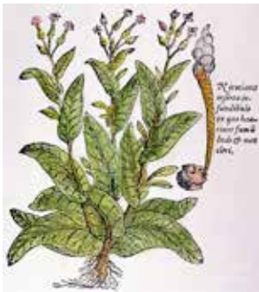
Φυτό καπνού ( Nicotiana tabacum ), με την παλαιότερη απεικόνιση τοιγάρου (Ξυλογραφία από το έργο « Stirpium adversaria nova » του Matthaeus Lobelius του 1576).

Η καλλιέργεια του καπνού στον ελλαδικό χώρο παρουσιάζει ιστορική συνέχεια περίπου 4 αιώνων, ξεπερνώντας σε διάρκεια την ηλικία του σύγχρονου ελληνικού κράτους.