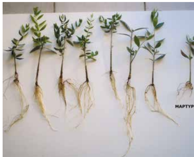
Επίδραση εμβολιασμού με μυκόρριζες στη ριζοβολία μοσχευμάτων ελιάς. Το κάθε φυτό (εκτός του μάρτυρα) έχει εμβολιασθεί με μυκόρριζικό εμβόλιο προερχόμενο από διαφορετική περιοχή της Ελλάδας.

Τα αποτελέσματα του έργου, εκτός από το ότι μας βοηθούν να κατανοήσουμε το ρόλο των ΔΜΜ στα οριακά αμμοθινικά οικοσυστήματα, αποτελούν μια πρώτη ενθαρρυντική ένδειξη ότι η στοχευόμενη αξιοποίηση συγκεκριμένων γηγενών μυκόρριζικών απομονώσεων σε μη αρδευόμενα συστήματα καλλιέργειας ή σε εδάφη υψηλής αλατότητας θα μπορούσε να οδηγήσει σε σημαντική βελτίωση της φυτικής παραγωγής στα ξηρικά μεσογειακά ή υποβαθμισμένα οικοσυστήματα.