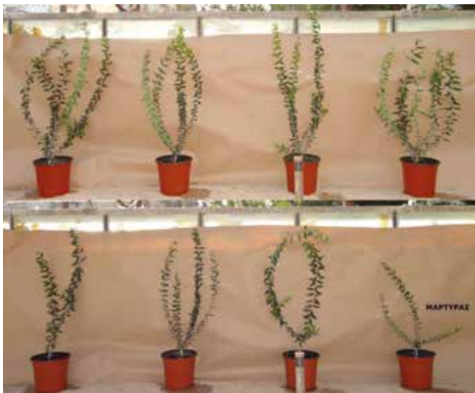
Επίδραση των μυκόρριζων στην ανάπτυξη δενδρυλλίων ελιάς. Το κάθε φυτό (εκτός του μάρτυρα) έχει εμβολιασθεί με μυκόρριζικό εμβόλιο προερχόμενο από διαφορετική περιοχή της Ελλάδας.

θινικών φυτών, το Medicago marina και Eryngium maritimum , πραγματοποιήθηκε ανάλυση της ποικιλότητας των ΔΜΜ με αλληλούχιση σε σύστημα MiSeq-illumina, χρησιμοποιώντας κατάλληλα ζεύγη DNA εκκινητών. Σκοπός ήταν να διερευνηθεί αν το είδος του φυτού ή η περιοχή από την οποία συλλέχθηκε καθορίζουν τη δομή της μυκόρριζικής του κοινότητας.