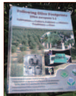
Πληροφορίες: Ινστιτούτο Ελιάς & Υποτροπικών Φυτών Χανίων, τηλ.: 28210 83442

Στο βιβλίο υπάρχει τεκμηριωμένο υλικό με ιστορικές φωτογραφίες (851) και το κεντρικό θέμα του είναι η “ελιά και οι άνθρωποι”. Στόχος του βιβλίου είναι να κρατήσει ζωντανή την ιστορία, τον πολιτισμό και τις παραδόσεις που συνδέονται με την ελιά, πριν χαθούν με το χρόνο μαζί με τις παλαιότερες γενιές. Επιπλέον, να αυξήσει την ευαισθητοποίηση του πληθυσμού για τις ευεργετικές ιδιότητες του λαδιού και των προϊόντων της ελιάς στην υγεία του ανθρώπου. Τέλος αναφέρεται στις ομοιότητες και ιδιαιτερότητες όσον αφορά το ελαιολάδο μεταξύ χωρών με διαφορετικούς πολιτισμούς. Αποτελεί ένα ταξίδι της ανακάλυψης για το μυαλό και την ψυχή, αφού ανταποκρίνεται στις ανάγκες των αναγνωστών επιστημόνων, ερευνητών και μη ειδικών με την κάλυψη ενός πλήθους θεμάτων για κάθε χώρα (εισαγωγή, ιστορία, περιοχή ελιών, ποικιλίες, οικονομική και περιβαλλοντική επίδραση, πολιτιστικές πρακτικές, μέθοδοι επεξεργασίας, παραδόσεις και πολιτισμός, κουζίνα, δημοφιλείς ιατρικές και καλλυντικές χρήσεις, τουρισμός, χρήση του ξύλου ελιών και υποπροϊόντα κ.ά.).