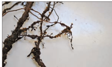
Ρίζες μελισσόχορτον με προσβολή από νηματώδεις του γένους Meloidogyne