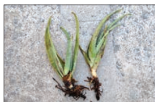
Ρίζες αλόης με προσβολή από νηματώδεις του γένους Meloidogyne . Πάνω μητρικό φυτό, κάτω παραφυάδες

πτώσεις πρακτικά αδύνατη. Η περίπτωση των αρωματικών και φαρμακευτικών φυτών παρουσιάζει ιδιαίτερη δυσκολία λόγω της απαγόρευσης χρήσης χημικών νηματωδοκτόνων, καθώς και λόγω του γεγονότος ότι κάποια από αυτά καλλιεργούνται ως πολυετείς καλλιέργειες. Για τα δεδομένα της Ελλάδας δεν υπάρχουν άλλες καταγραφές που να αφορούν την παρουσία φυτοπαρασιτικών νηματωδών σε καλλιέργειες αρωματικών και φαρμακευτικών φυτών ούτε και πειραματικά αποτελέσματα που να αξιολογούν την αποτελεσματικότητα βιολογικών σκευασμάτων για την καταπολέμησή τους.