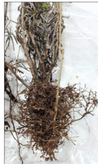
Ρίζα λεβάντας με προσβολή από νηματώδεις του γένους Meloidogyne