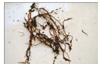
Καλλιεργούμενα φυτά μαλοτήρας και ρίζες με προσβολή από νηματώδεις του γένους Meloidogyne

Πληροφορίες: Εργαστήριο Νηματωδολογίας, Τμήμα Αμπέλου, Λαχανοκομίας, Ανθοκομίας και Φυτοπροστασίας, Ινστιτούτο Ελιάς, Υποτροπικών Φυτών και Αμπέλου, Καστοριάς 32Α, Μέσα Κατσαμπάς, 71307, Ηράκλειο Κρήτης τηλ.: 2810 302305, e-mail: etzortza@nagref.gr