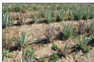
Προσβολή από νηματώδεις του γένους Meloidogyne σε καλλιέργεια αλόης. Τα προσβεβλημένα φυτά έχουν καφέ χρώμα λόγω ανεπαρκούς πρόσληψης νερού και θρεπτικών στοιχείων από το έδαφος