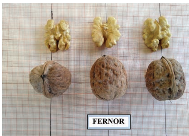
Ποικιλία καρυδιάς Fernor